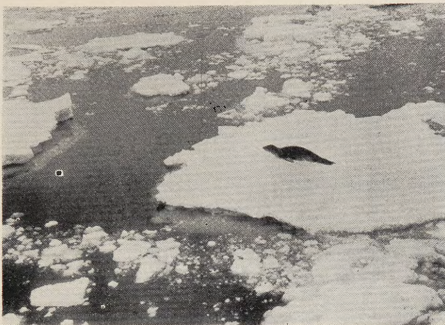
Fig. N° 7: Foca leopardo reptando sobre un trozo de hielo. Se aprecia claramente su si ueta reptiliana, Estrecho Bransfield.