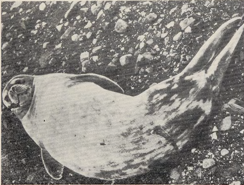
Fig. Nº 6: Foca de Weddell macho.

Nótese la diferencia de tonalidades debido a la humedad del pelaje. Isla Rey Jorge.