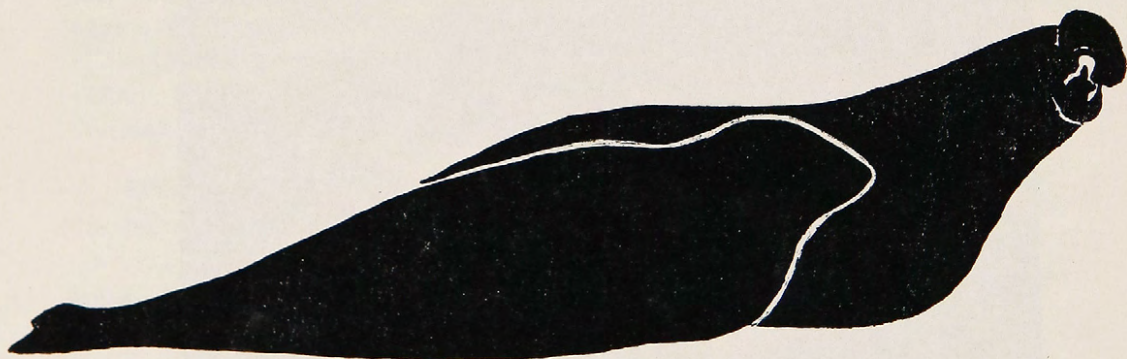
e) Foca elefante. En primer plano, hembra, en segundo plano macho, 6-8 mts.