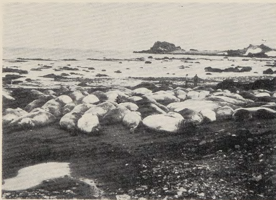
Fig. N° 8: Concentración de machos de foca elefante. Is'ia Rey Jorge.