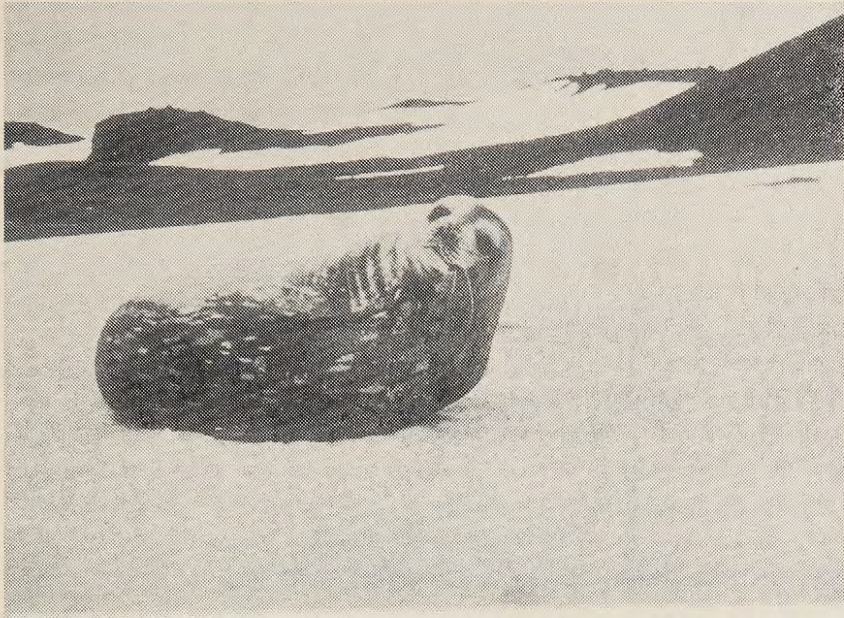
Fig. Nº 5: Foca de Weddell hembra.