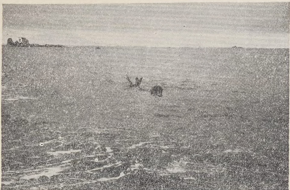
Fig. Nº 9: Ejemplar hembra de foca e'efante, boyando. Isla Rey Jorge.