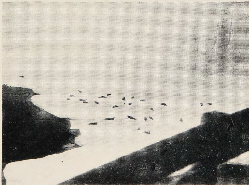
Fig. Nº 4: Grupo de focas de Weddell 1 descansando en la banquisa de la Isla Astrolabio, Península Antártica.