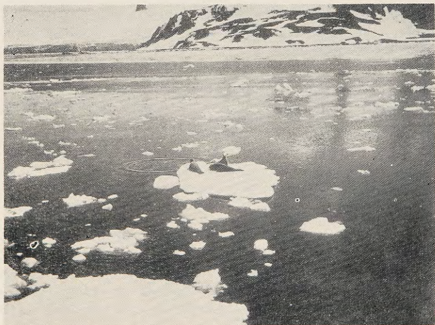
Fig. N° 2: Ejemp'ares de foca cangrejera. Bahía Almirantazgo, Is'la Rey Jorge.