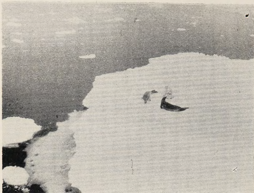
Fig. Nº 3: Focas cangrejeeras cuya piel presenta diferentes tonalidades en su coloración.