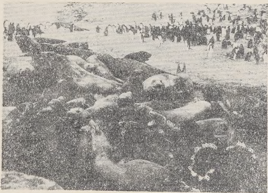
Fig. Nº 10: Concentración de hembras de foca elefante, en las que se aprecia diferentes tonalidades en la coloración de la piel. Isla Rey Jorge.