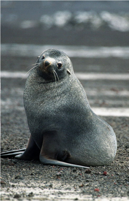
Fig. 5 Lobo Fino Antártico ( Arctocephalus gazella ).

( https://es.wikipedia.org/wiki/Arctophoca_gazella#/media/File:Antarctic,_sea_lion_(js)_64.jpg )