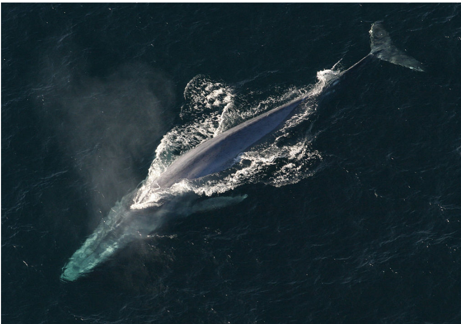
Fig. 2. Ballena Azul o Rorcual Gigante ( Balaenoptera musculus ).