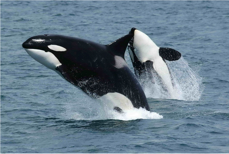
Fig. 3 Orca ( Orcinus Orca ).

( https://commons.wikimedia.org/wiki/Orcinus_orca?uselang=es#/media/File:Killerwhales_jumping.jpg )