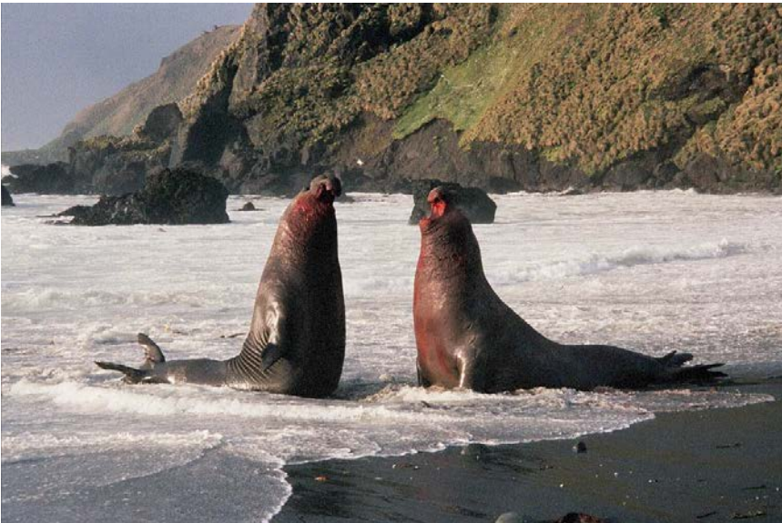
Fig. 6 Foca Elefante del Sur ( Mirounga leonina ).