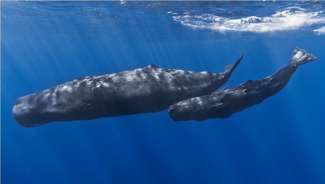
Fig. 4 Cachalote ( Physeter macrocephalus ).