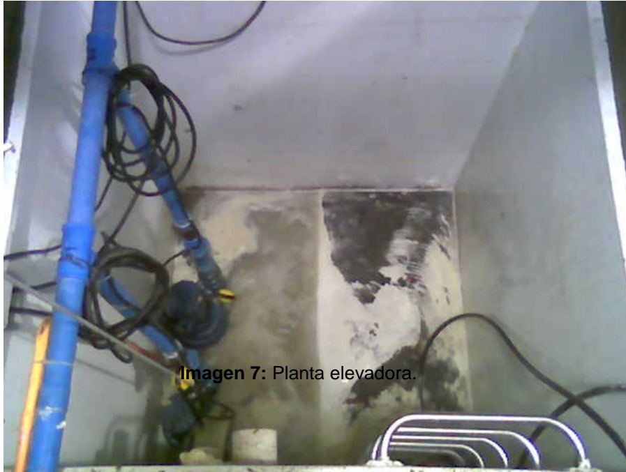
Imagen 7: Planta elevadora.