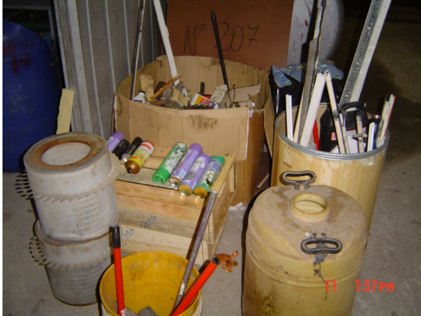
Imagen 5: acopio de desechos industriales para posterior evacuación.