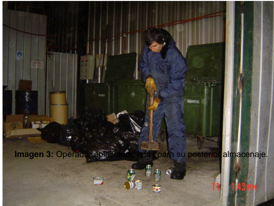
Imagen 3: Operador aplastando latas para su posterior almacenaje.