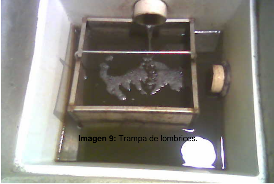
Imagen 9: Trampa de lombrices.