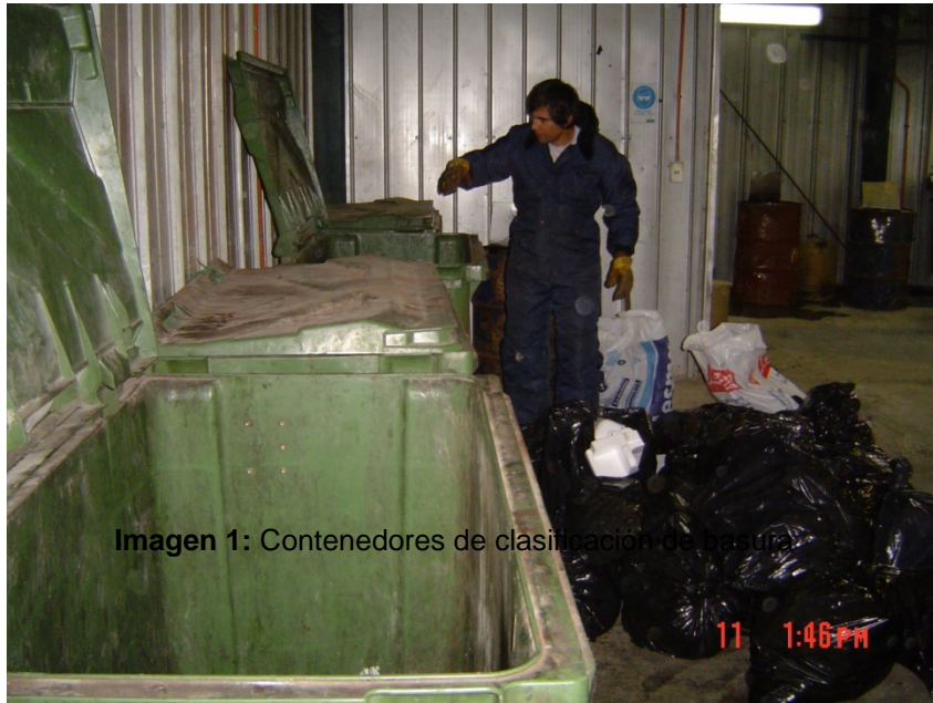
Imagen 1: Contenedores de clasificación de basura.