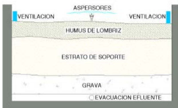
Figura 1: Capas de filtrado del sistema Tohá

La idea general de este sistema es separar a través de filtros los residuos sólidos sobre 4 mm. Posterior, el líquido ser bombeado a una serie de capas, las que hacen las veces de filtro físico y biológico, reteniendo estos en el aserrín, el cual es comido por las lombrices, las que a su vez forman Humus, es decir, un fertilizante natural.