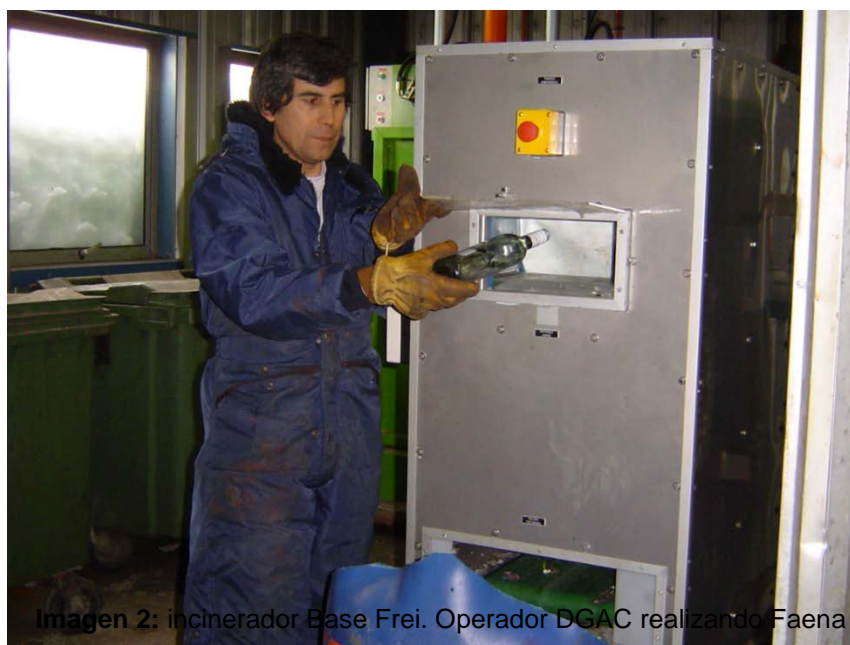
Imagen 2: incinerador Base Frei. Operador DGAC realizando Faena de quema de basura.