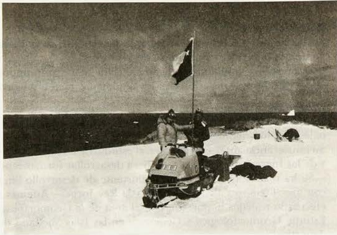
Proyectos sobre estudios Glaciológicos